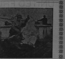
Escena a bordo del buque del explorador Cook en los mares polares

Vista del «John R. Broadley» buque en el cual fue el Dr. Cook, de New York a Greenland.